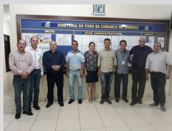
Diretores do SINDOJUS/MT visitam comarcas do interior de Mato Grosso