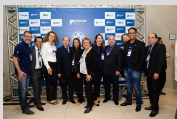
Congresso Nacional dos Oficiais de Justiça