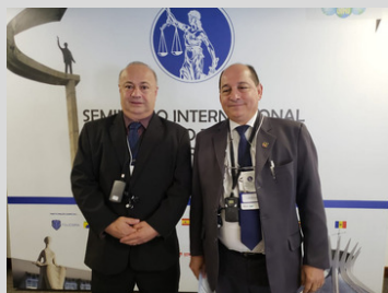
Presidente e vice-presidente do SINDOJUS/MT em viagem à Brasília

VIAGENS COM REPRESENTANTES COMARCAS R$ 11.678,23 COMBUSTÍVEIS VIAGENS INTERIOR R$ 11.720,91 HOSPEDAGEM E REFEIÇÕES INTERIOR R$ 43.640,96 HOSPEDAGEM E REFEIÇÕES BRASÍLIA R$ 40.857,12 LOCOMOAÇÃO BRASÍLIA R$ 1.802,81 PASSAGENS AÉREAS R$ 38.227,68